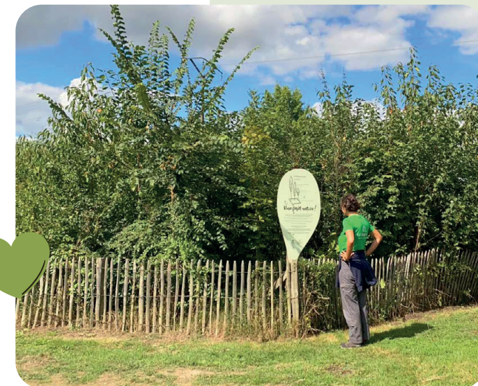
La forêt d'Alice, à Vertou

En récrant les strates d'une forêt naturelle , en stimulant la croissance et la coopération des arbres, la forêt deviendra autonome en 2 à 3 ans.